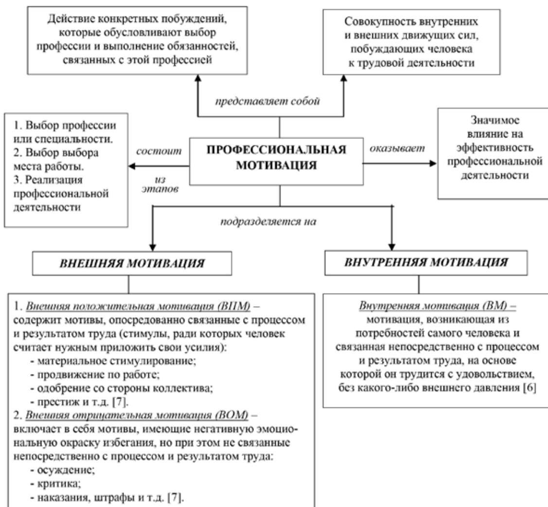
Рис. 1. Интеллект-карта понятия «Профессиональная мотивация»