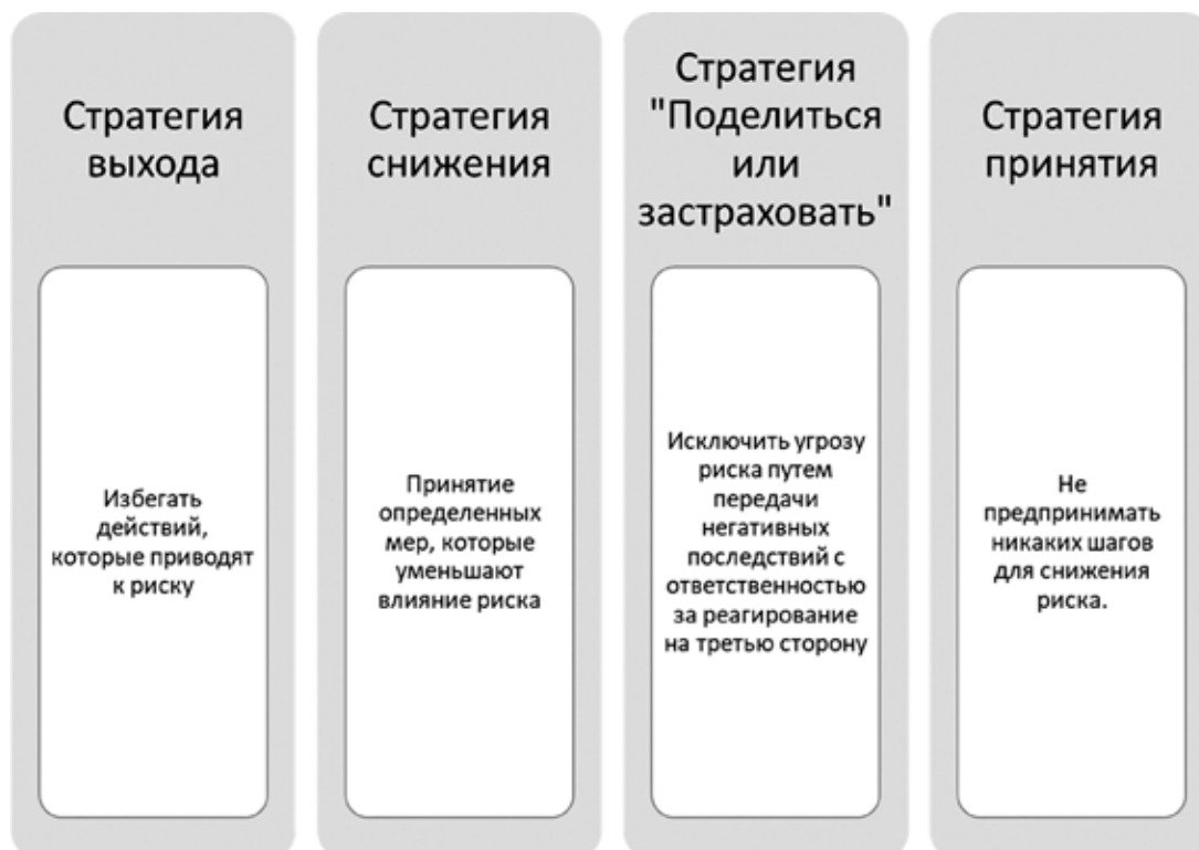
Рис. 1. Основные стратегии управления рисками на предприятии

Все виды рисков взаимосвязаны и оказывают прямое непосредственное влияния на деятельность предпринимателя. И изменение одного вида риска может вызвать изменение всех остальных.